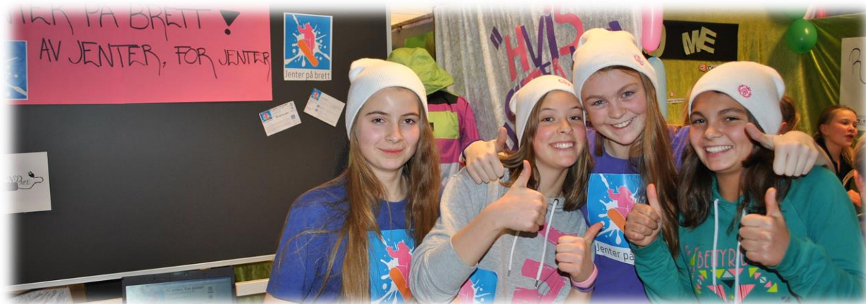
Elevbedriften "Jenter på Brett" fra Hol ungdomsskole på Geilo holder snøbrettkurs for jenter – med slagordet "av jenter for jenter".

Elevbedrift er et pedagogisk program som dekker alle kompetansemålene i valgfaget "produksjon av varer og tjenester". Lærer kan bruke de ulike fagressurser for Elevbedrift som ligger på www.ue.no , og det vil være naturlig å vektlegge de stegene i Elevbedrift som fokuserer på utvikling og produksjon av varer og tjenester. UE holder kurs for lærere i Elevbedrift hvert år. Se www.ue.no i ditt fylke for mer informasjon.