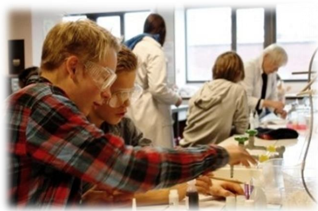
Elever i aktivitet under TeknoVisjon 2012

Kreative prosesser for å utvikle gode ideer er en naturlig entreprenørskapsaktivitet i faget. I tillegg kan partnerskapsavtale med en teknologisk bedrift være aktuelt for noen skoler.