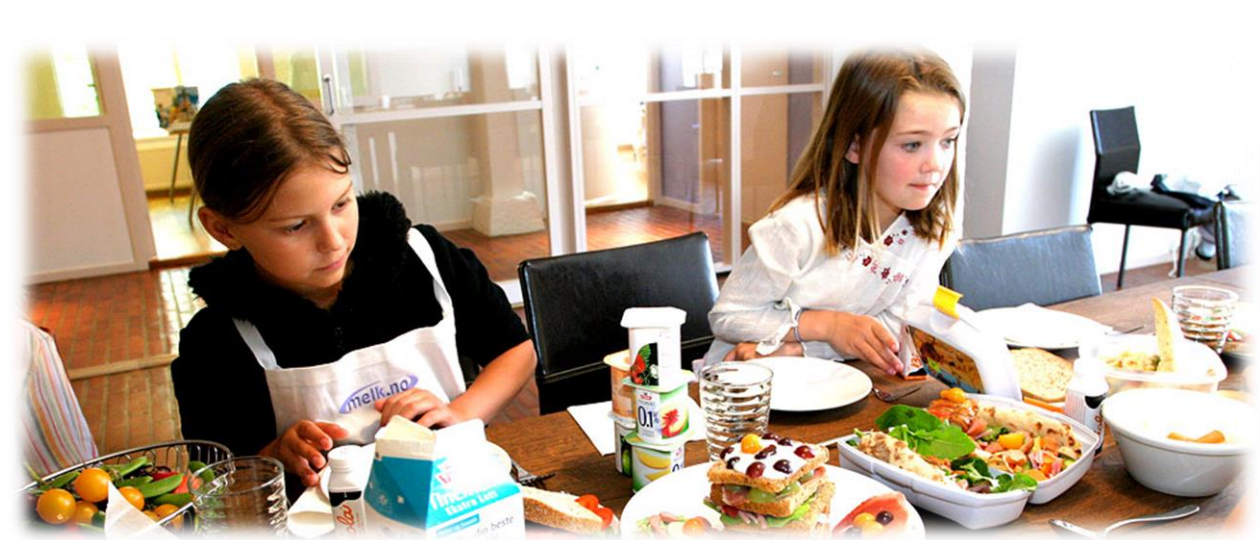
Elevbedriften Lønsj EB fra Majorstuen skole laget konsept for spennende og sunne matpakker.

Gründercamp er et program som utvikler elevenes medvirkning og forståelse. Dette kan være et element i dette valgfaget. En annen mulighet er en partnerskapsavtale med for eksempel barneskole eller idrettsklubb for å få gode læringsarenaer.